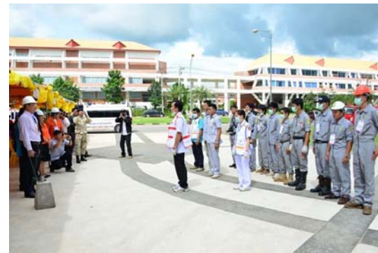
แบบจำลองสถานการณ์